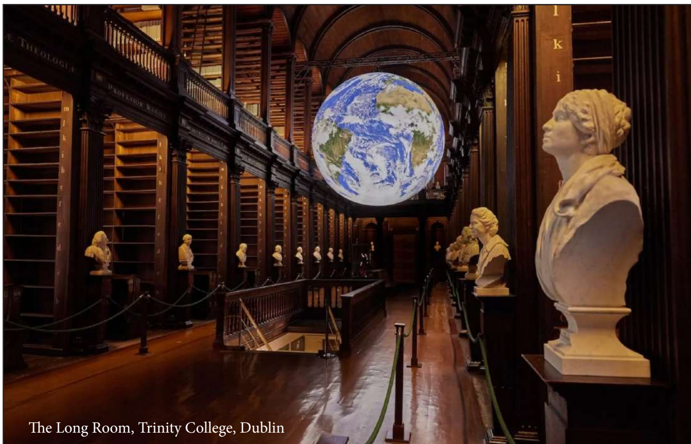
The Long Room, Trinity College, Dublin