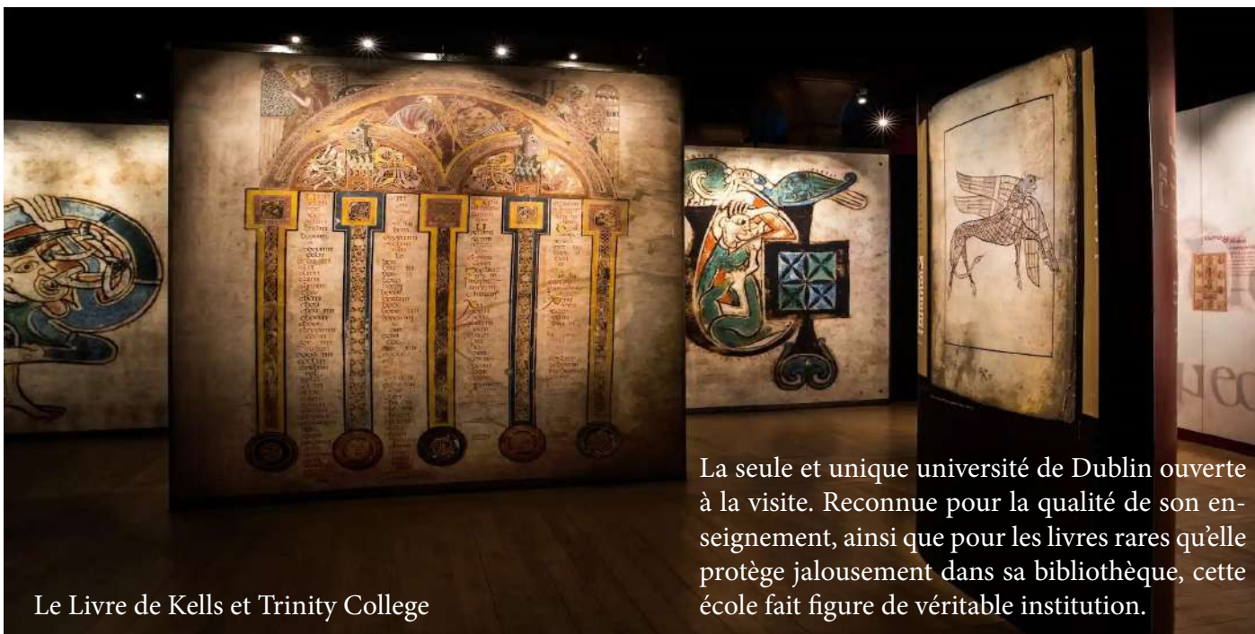
Le Livre de Kells et Trinity College

Ce manuscrit magnifiquement enluminé contient les quatre évangiles du Nouveau testament en latin et date d'environ 800 après J.-C. Presque chacune de ses 680 pages présente des images sophistiquées représentant des créatures mythiques, des animaux sauvages et domestiques, des icônes chrétiennes et des symboles celtiques.